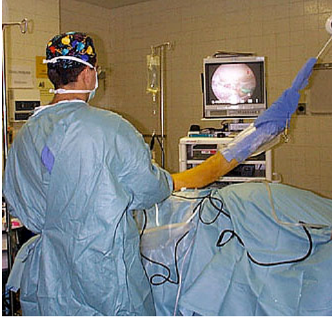
Operasjon i sideleie med strekk på armen