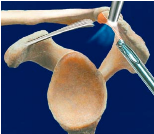
Med fres fjernes ben for å skape mer plass